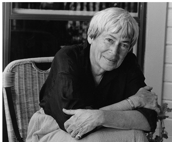
LeGuin in 1996

Am 22. Januar 2018 starb Ursula K. Le Guin im Alter von 88 Jahren. Kaum eine Autorin prägte die Phantastik und Science Fiction so sehr wie Le Guin. Ihre Bücher behandeln die ganz großen Fragen nach Menschlichkeit, nach Verlust und dem Streben nach Glück und Wissen. Ihre Charaktere waren selten konventionell, selten heteronorm, selten weiß. Sie selbst beschrieb ihre Figuren als „regenbogenfarben“ („A Whitewashed Earthsea“ Slate Dez. 16 2004) und sprach sich immer wieder deutlich gegen Kapitalismus, Rassismus, Misogynie und Homophobie aus. Ihre Bücher spiegeln ihre weltoffene Einstellung in wunderbar bunter und fantasievoller Weise wieder. Ich persönlich hoffe, dass die vielfältige Berichterstattung zu Le Guins Tod dazu führt, dass eine neue Generation die Bücher dieser wundervollen Autorin entdeckt und dass Liebhaber die Bücher wieder einmal zur Hand nehmen.